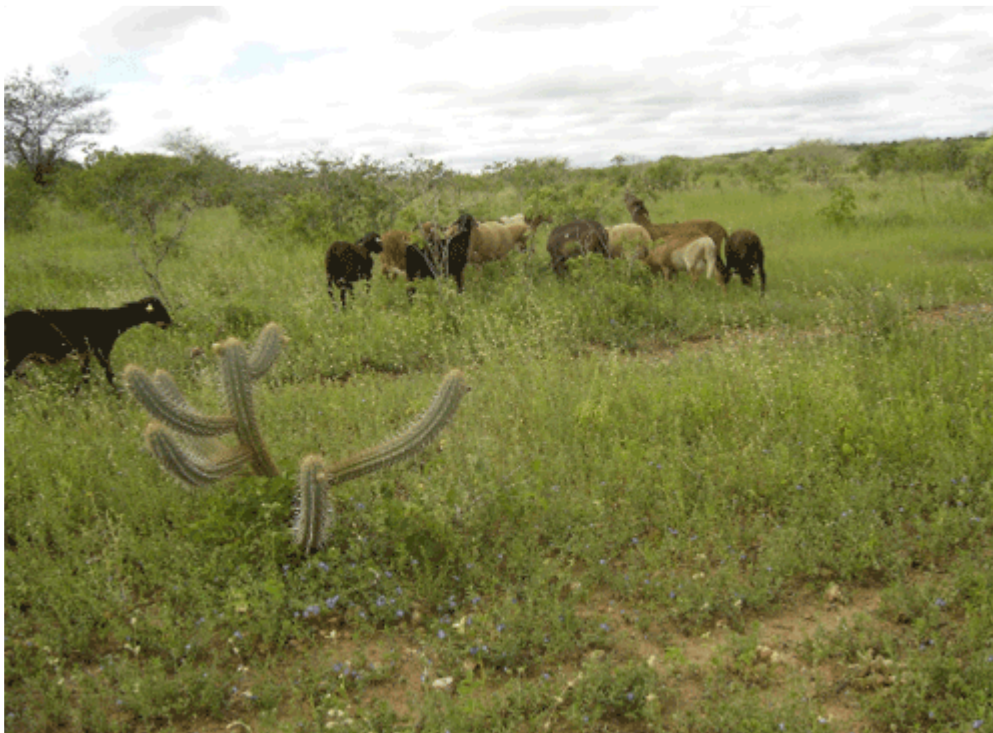
Figura 5 - Avaliação das respostas fisiológicas dos animais ao estresse térmico.