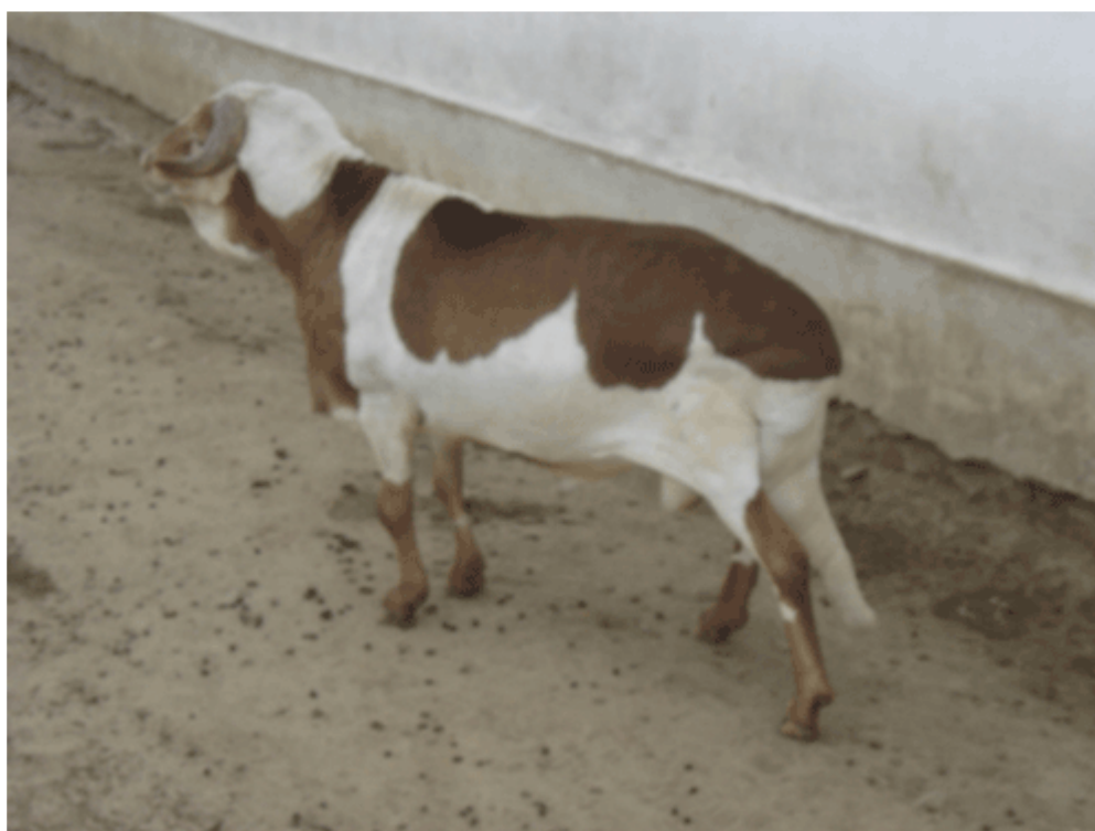
Figura 3 - Reprodutor da Raça Damara.

A raça Damara é uma variação da raça Africânder com as raças Namaqua e Ronderib. O Africânder, por sua vez, descende da raça deslanada Hotentote, que herdou a cauda gorda das ovelhas de rabo-largo do leste asiático e a cauda longa das ovelhas egípcias. A raça Damara, portanto, descende de ovelhas de pernas longas na região