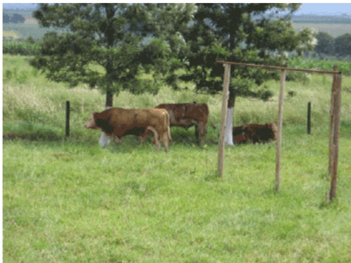
Figura 5. Animais em ruminção e em ócio sob a sombra natural

Silva et al. (1996) estudaram o efeito do sombreamento natural e artificial no estresse térmico mensurando a temperatura de globo negro (tg) e a Carga Térmica Radiante (CTR). Foram utilizadas como cobertura natural as espécies Caesalpinia peitophoroides (Sibipiruna), Lecythis pisonis (Sapucaia) e Tipuana speciosa (Tipuana) e como cobertura artificial telhas de cimento amianto.