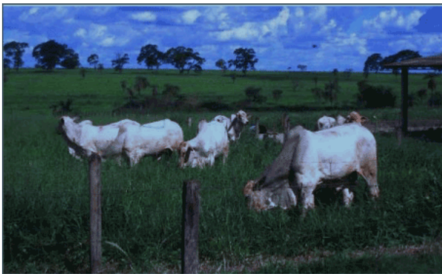
Figura 8. Animais Nelore em pastejo

A raça Sindi, originária do Paquistão, de uma região de clima semi-árido, com precipitação anual média de 250-300 mm, é hoje uma alternativa viável e comprovada para o desenvolvimento sustentável da pecuária do nordeste brasileiro, pois dois terços do território do Brasil encontram-se na faixa tropical, onde predominam as altas temperaturas na maior parte do ano (6 a 8 meses) com temperatura média à sombra variando em 35 e 39°C, em consequência da elevada radiação solar incidente. Além dos efeitos do estresse calórico, as estiagens e secas periódicas prejudicam a produção de forragens. Nesse contexto as raças especializadas na produção de leite e carne de origem européia são altamente prejudicadas.