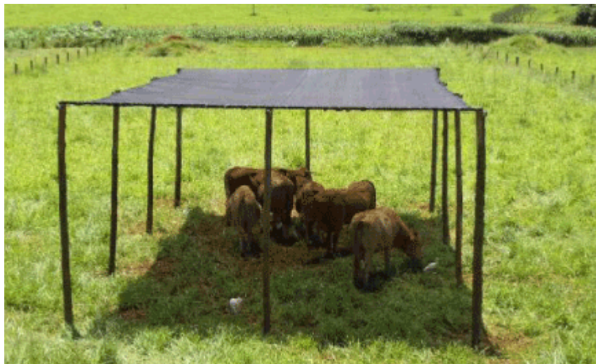
Figura 6. Animais Caracu utilizando a Sombra Artificial

A raça Aberdeen-Angus é originária de um grupo relacionado às raças mochas locais do nordeste e centro da Escócia, em clima que exigia animais vigorosos (FELIUS, 1985; FRASER, 1959; WILLIAMS, 1967, citados por GLASER, 2008). As principais características dessa raça são: a baixa mortalidade dos bezerros, facilidade de parto, fator genético dominante para ausência de chifres, alta conversão alimentar, precocidade sexual, grande velocidade de ganho de peso, produção de carcaça de alta qualidade. Sua carne é reconhecida como a melhor em todo o mundo, com base nas características de maciez, suculência e marmoreio, tornando, portanto as perspectivas de comercialização as melhores possíveis. Contudo, para apresentar o máximo de sua capacidade genética produtiva, necessita de condições de conforto térmico adequadas.