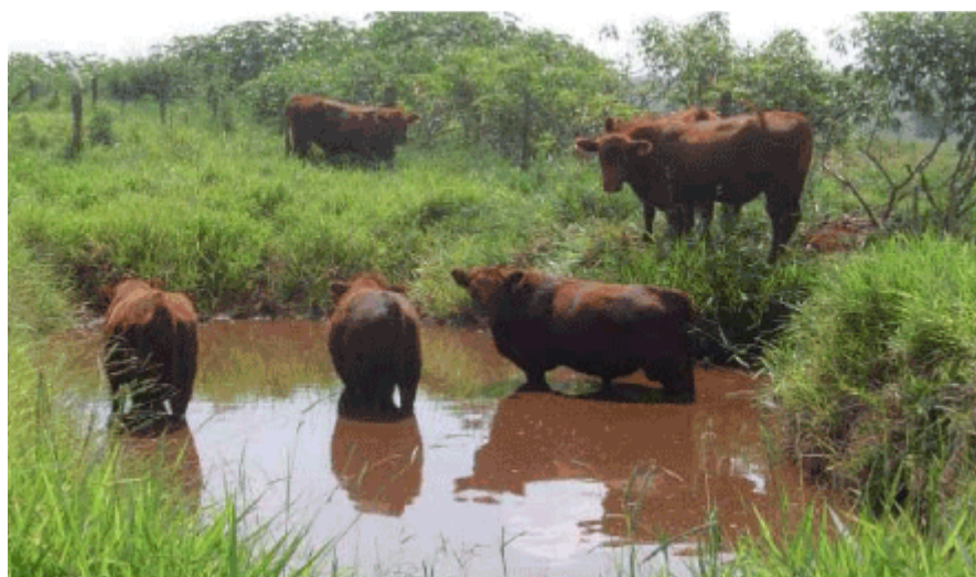
Figura 7. Animais Angus utilizando a água para imersão

Há diferenças marcantes entre os zebuínos e os taurinos, principalmente em termos de tolerância ao calor. Os zebuínos são originários de países de clima quente,