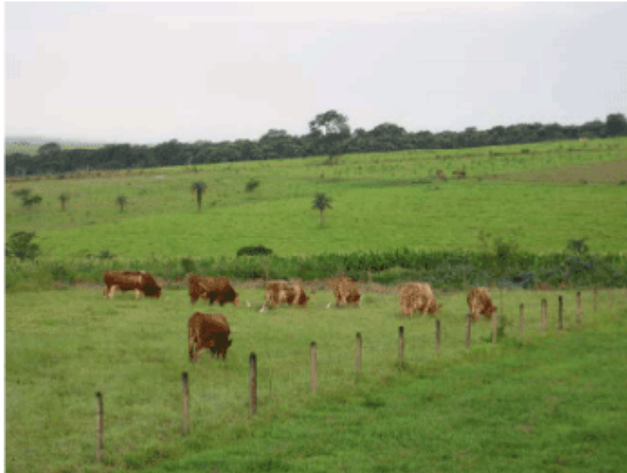
Figura 3. Animais em pé em ócio no tratamento sem sombra